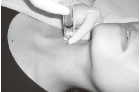
右側の星状神経節ブロック

舌に異常はないのに粘膜炎や射による治療が有効です。舌が痛い、神経障害性疼痛(歯科治療が終わったにも関わらず歯や顎が痛い)などが挙げられます。 また、歯や顎の痛みが顎を動かす筋肉の慢性疼痛に「首を動かす筋肉の慢性疼痛」が原因であったり、顎の痛みが実は頭痛であったり、多種多様です。治療はケースバイケースですが、薬物療法や理学療法(マッサージやストレッチ)で症状が緩和します。当付属病院では「口・顔・頭の痛み外来」で医師と歯科医師が診察にあたり最善の治療方針を決定します。 慢性疼痛は経過が長い分、治療方針の決定や寛解・治癒にもある程度の期間が必要です。稀ではありますが、歯、顎、舌、口の中の痛みで長くお困りの方は、本学付属病院の「口・顔・