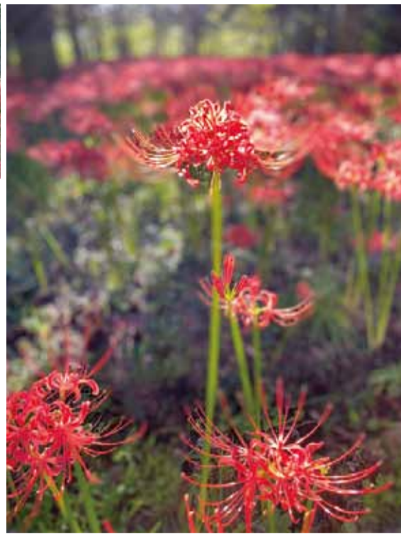
村上緑地公園(八千代市地域振興財団)

シーズン中は、例年約1万4000人が来場する。彼岸花は自然に咲いたわけではなく、植栽を始めて今年で9年目。当初は荒れた公園だったが毎年捕