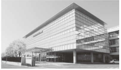
日本大学松戸歯学部付属病院

鼻、喉の検査を行います。私たちの経験では、歯科を受診した粘膜類天疱瘡の患者さんのうち、約4割の人が上気道(鼻、咽頭、喉頭など)にも病気が合併していました。 粘膜類天疱瘡の歯肉症状は、プラークが原因である通常の歯肉炎と同様に、発赤や出血、腫れがみられます。そのため、患者さんはまず歯科を受診します。注意深く口の中を観察し、患者さんの訴える症状をよく聞き、通常の歯肉炎と鑑別することが大切です。 歯周治療や、抗菌薬処方での治療効果はないこと、また、血液検査や細菌検査でも診断できないのが現状です。診断を確定するには歯肉を切り取る病理組織検査が必要になります。 私たちは、歯科と耳鼻咽喉科の連携の必要性を、学会発表や論文を通して世界に向けて発信しています。